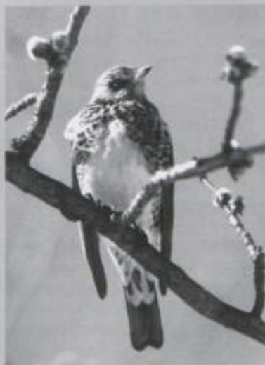
На адмыку: ДРОЗД-ПІСКУН ( Turdus pilaris ) (фота А.Несцежава, фотаконкурс-2002, 1-е месца)