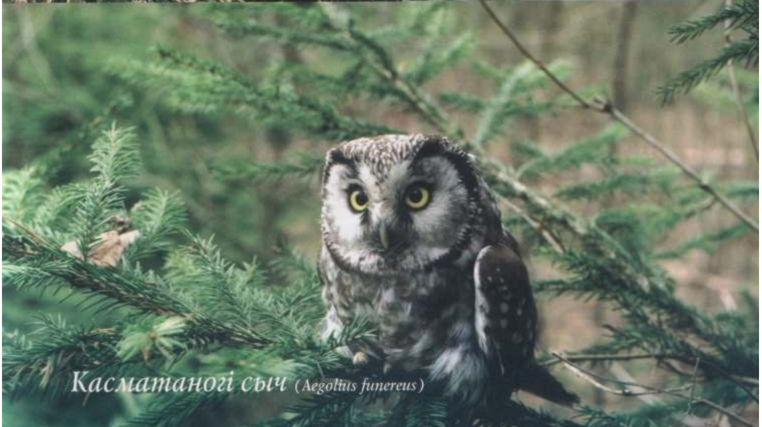
Касматаногі сыч ( Aegolius funereus )