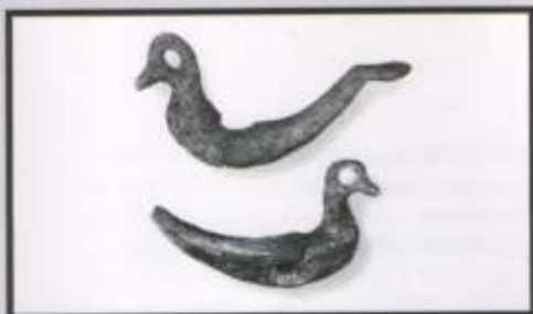
Жаночае ўпрыгожанне – касцяныя качачкі. XI ст. Курганы паблізу в.Баркі. Полацкі раён

Гісторыя жывой прыроды на тэрыторыі Беларусі налічвае сотні мільёнаў гадоў. І толькі сто тысяч гадоў таму тут з'явіліся першыя людзі.